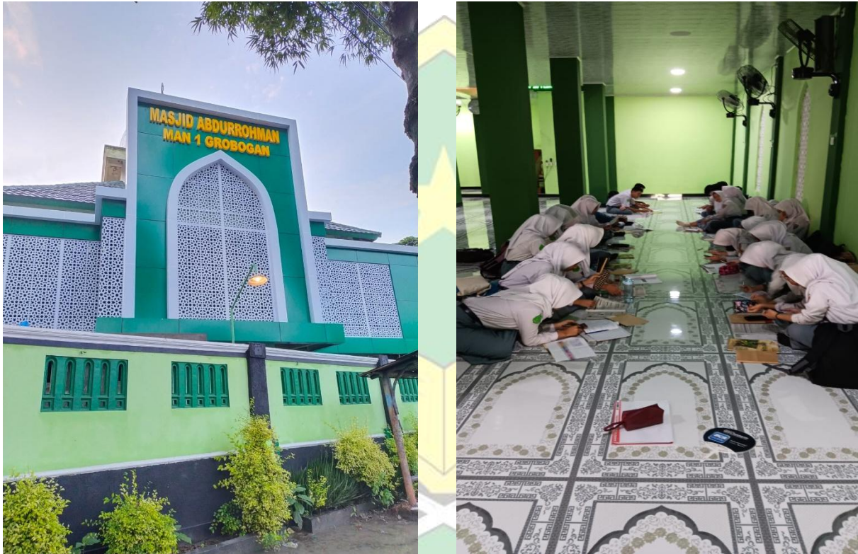
Gambar 2.1 Gambar Masjid Abdurrohman MAN 1 GROBOGAN