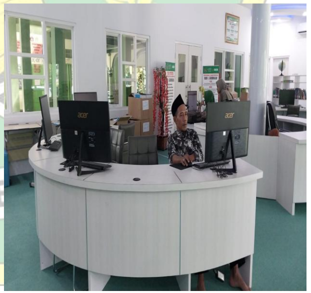
Gambar 2.5 Perpustakaan Ko Hajar Dewantoro MAN 1 GROBOGAN