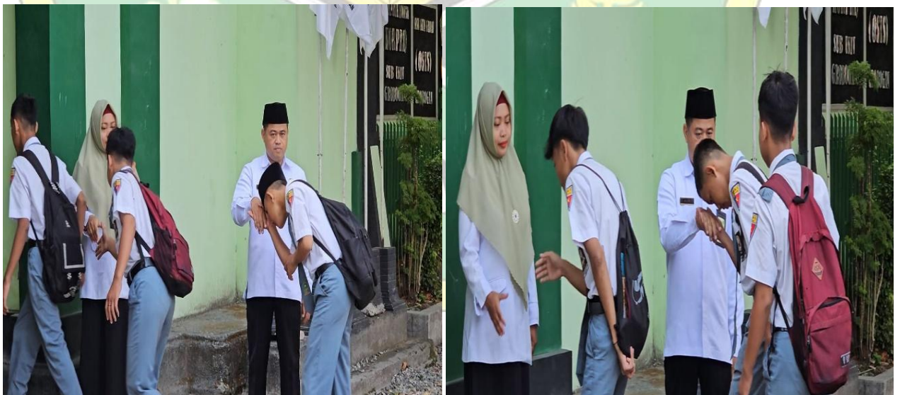
Gambar1.1 kegiatan Salam Salim di pagi hari

3 budaya mutu tersebut telah dilaksanakan oleh seluruh siswa di MAN 1 Grobogan.