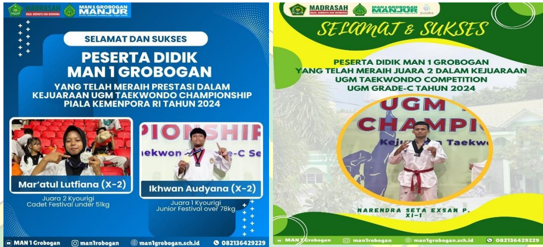
Gambar 1.1 kegiatan ajang kompetisi siswa MAN 1 GROBOGAN