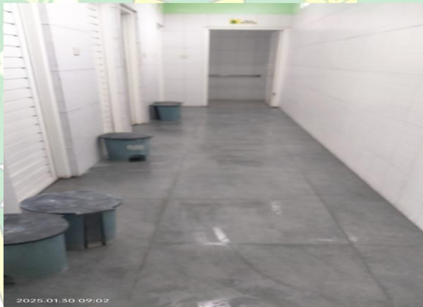
Gambar 2.4 Gambar Toilet bersih MAN 1 GROBOGAN