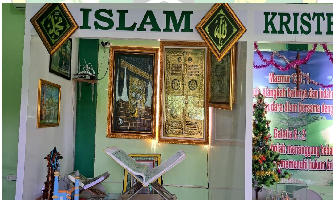
Gambar 2.3 Gambar Laboratorium Moderasi Beragama MAN 1 GROBOGAN