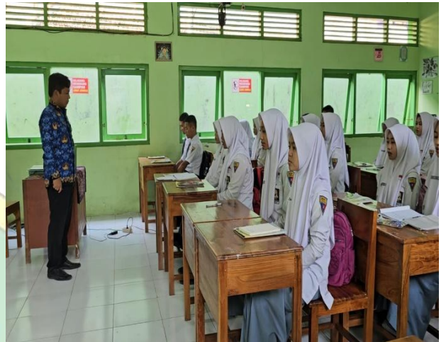
Gambar 1.2 kegiatan Doa awal pembelajaran