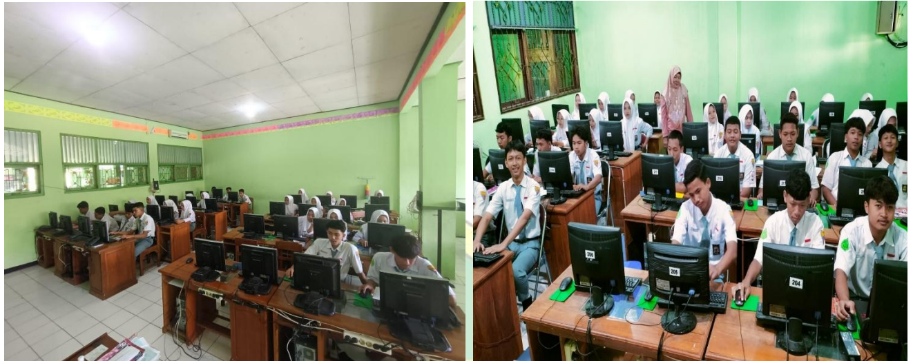
Gambar1.4 Kegiatan Pemanfaatan TIK dalam kegiatan pembelajaran Man 1 Grobogan